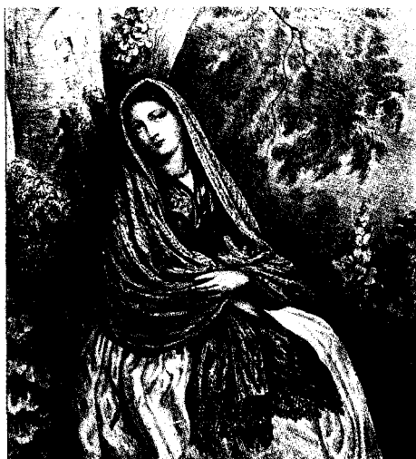
Los aztecas: de Aztlán a Tenochtitlan

se expresan en la necesidad de hablar y ser escuchado, de que le hablen y poder escuchar.