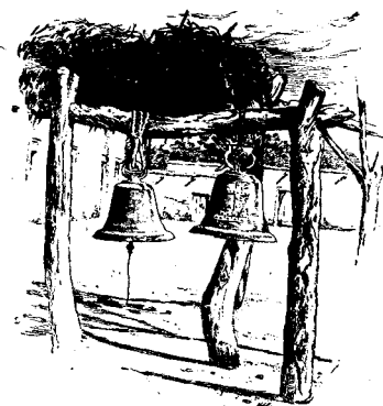
Navegación y comercio en el Golfo de California durante la época colonial.