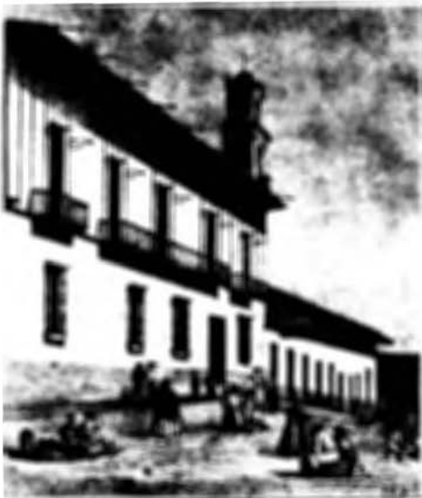
Centro de Investigaciones Históricas